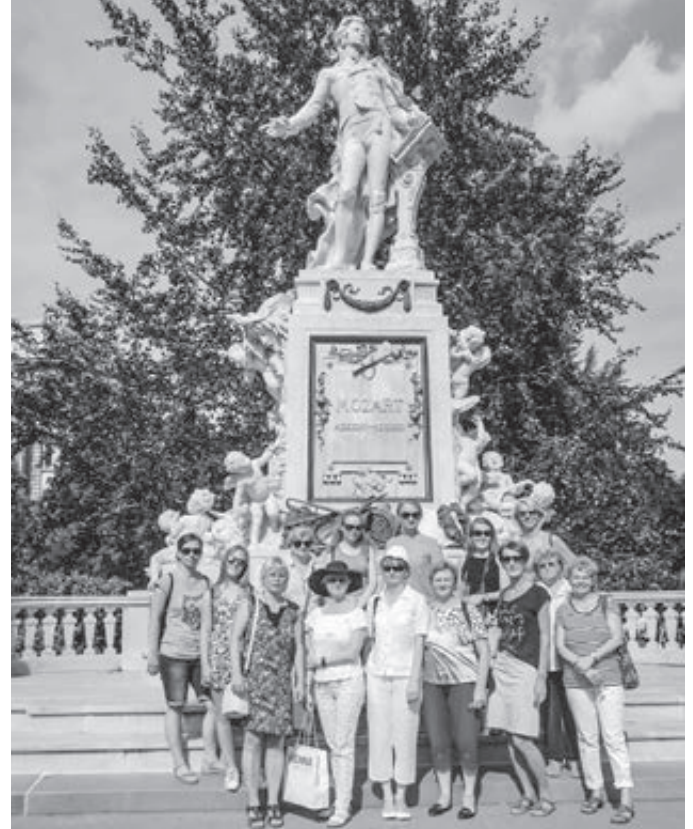
Pri soche hudobného géniá W. A. Mozarta

Na nasledujúcej zastávke vo Volksgarten je umiestnené jeho ďalšie zaujímavé súsošie Tritón a nymfa, ktoré nám bolo akosi povedomé. Sprievodkyňa nám potvrdila, že nás pamäť neklame. Originál sa nachádza v Bratislave v GMB a ešte jedna kópia je umiestnená v dvorane Primaciálneho paláca.