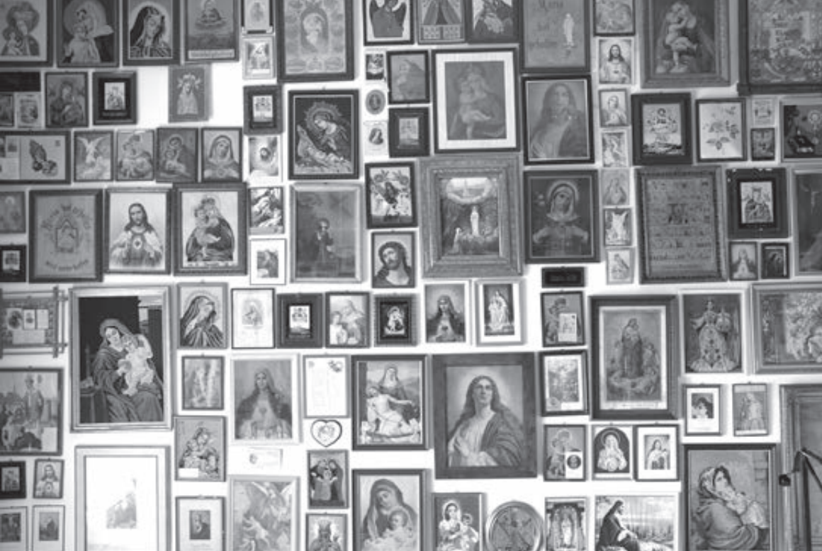
Votívne obrázky na stene vo veži