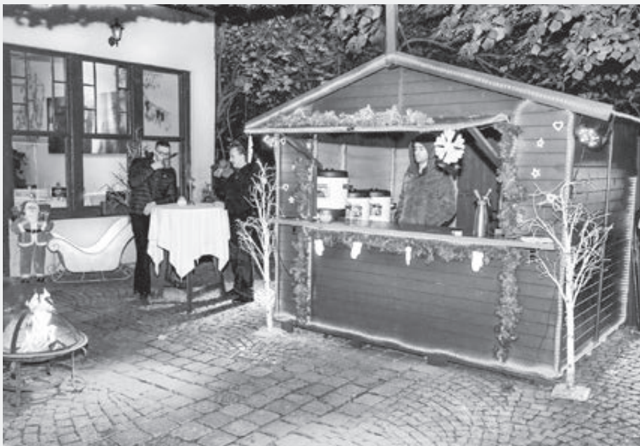
Adventný stánok s teplými nápojmi

Tridsaťročná tradícia našej reštaurácie pokračuje pod novým vedením. Raz sme tu sedeli ako hostia a žartovali s českým čašník, že by sme mohli podnik kúpiť. Ale majiteľ, ktorý v tretej generácii túto reštauráciu rekonštruoval, o tom ani nerozmýšľal. Keď majiteľ nečakane zomrel, prevzala vedenie jeho manželka s deťmi. Keďže neboli na situáciu