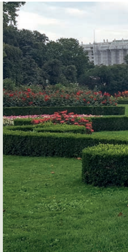
Volksgarten v strede Viedne

Len v niektorých kompetenciách dochádza k decentralizácii na 23 mestských obvodov. Okrem škôlok a škôl (aj hudobných), trhov a cintorínov, verejných WC a kúpalísk majú viedenské obvody na starosti ulice a verejné priestory, čistenie ciest, ich zimnú údržbu aj starostlivosť o mestskú zeleň a detské ihriská. Obvody poznajú dobre svoju situáciu a plánujú tieto činnosti vo svojom rozpočte. Ich realizáciou sú ale poverené príslušné oddelenia viedenského magistrátu, kde sú zastúpení špičkovi odborníci na konkrétnu problematiku mesta. Takto nepotrebujú obvody duplicitne odborníkov a mesto zabezpečuje rovnako kvalitný rozvoj v každej svojej časti. Nakoniec je to tak, že každý obyvateľ Viedne