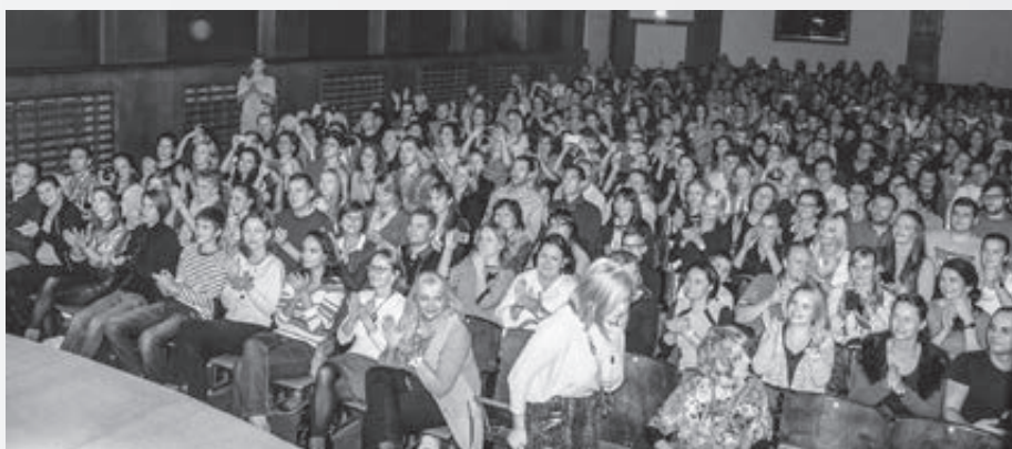
Také plné hľadisko sme dávno nezažili!

Ďakujem za rozhovor a bude nás tešiť, keď sa čoskoro opäť stretne na predstavení vo Viedni. ■