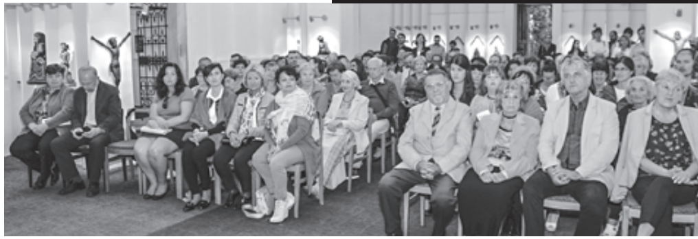
Zaplnený interiér kostola na Slanickom ostrove počas jedného z koncertov