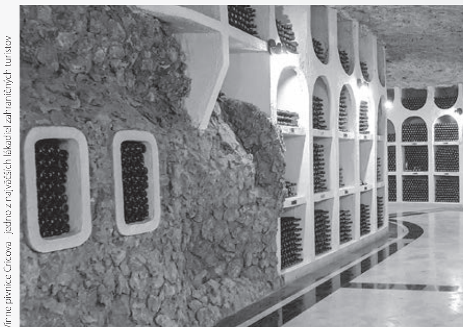
Vínne pivnice Cricova – jedno z najväčších lákadiel zahraničných turistov

Hoci zahraniční turisti cestujú do Moldavska hlavne kvôli vínu a zdržiavajú sa predovšetkým v hlavnom meste, väčšinou na ich itinerári nechýba ani toto miesto. Musím sa priznať, že mňa doslova očarilo – svojou polohou, mystickosťou i farbami. Je to úžasný skalný reliéf – keď sa naň postavíte, pod vami sa krúti rieka Raut, po ktorej práve plávali husi, a pred vami sa rozprestrú úrodné políčka, kam až oko dohľadne. Za vašim chrbtom sa nachádza dedinka Butuceni aj s malým dedinským cintorínom. O mystiku sa postarala jesenná hmla a o farebnú scénu do žltá sfarbené listy stromov. Na kopci upúta mariánsky kostolík z roku 1904 a malá zvonica, pod ktorou je vyhlbený tunel – dnes jediná prístupová cesta do jaskynného kláštora. V skalnom reliéfe je množstvo jaskyniek, ktoré v minulosti slúžili ako obytné cely pre mníchov, kedysi ich tu pobývalo až 400. Kláštor fungoval do roku 1816, ale aj dnes tu stretnete mnícha, ktorý tu pobýva, stará sa o podzemný kostol, zapaľuje sviečky a turistom otvára dvere do tunela. Orheiul Vechi je nielen dôležité historické miesto, ale je to aj symbol symbiózy človeka s prírodou. ■