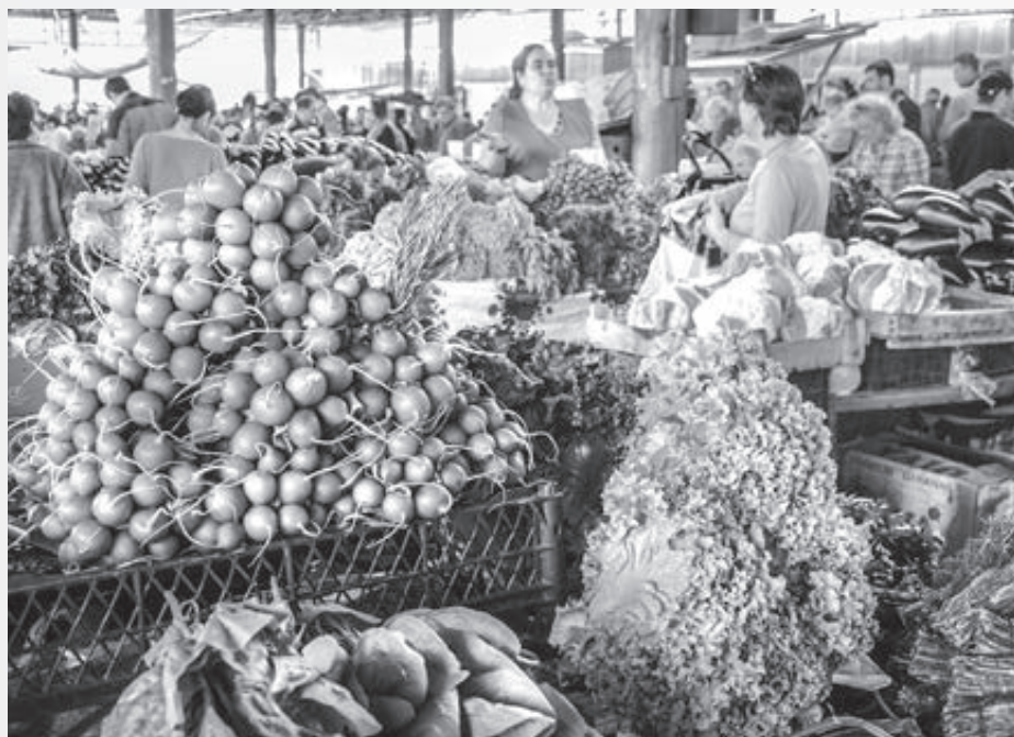
Trhovisko v moldavskej metropole je plné čerstvej zeleniny a ovocia

O budúcnosti Moldavska rozhodne to, ktorým smerom sa bude krajina orientovať.