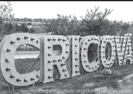
Pred vstupom do vinárskych pivníc v Cricove

a tlmočník). Ja som bol aj vodič a všetko ostatné. Zarobili sme 25 eur aj s prepitným (smiech). V súčasnosti máme 16 pracovníkov, robíme aj eventy, aj turizmus a pribudol nám tiež predaj leteniek. Máme kontrakty s japonskými cestovnými agentúrami, ale aj s nemeckými, rakúskymi alebo francúzskymi.