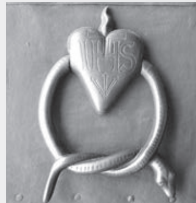
Detail na dverách baziliky