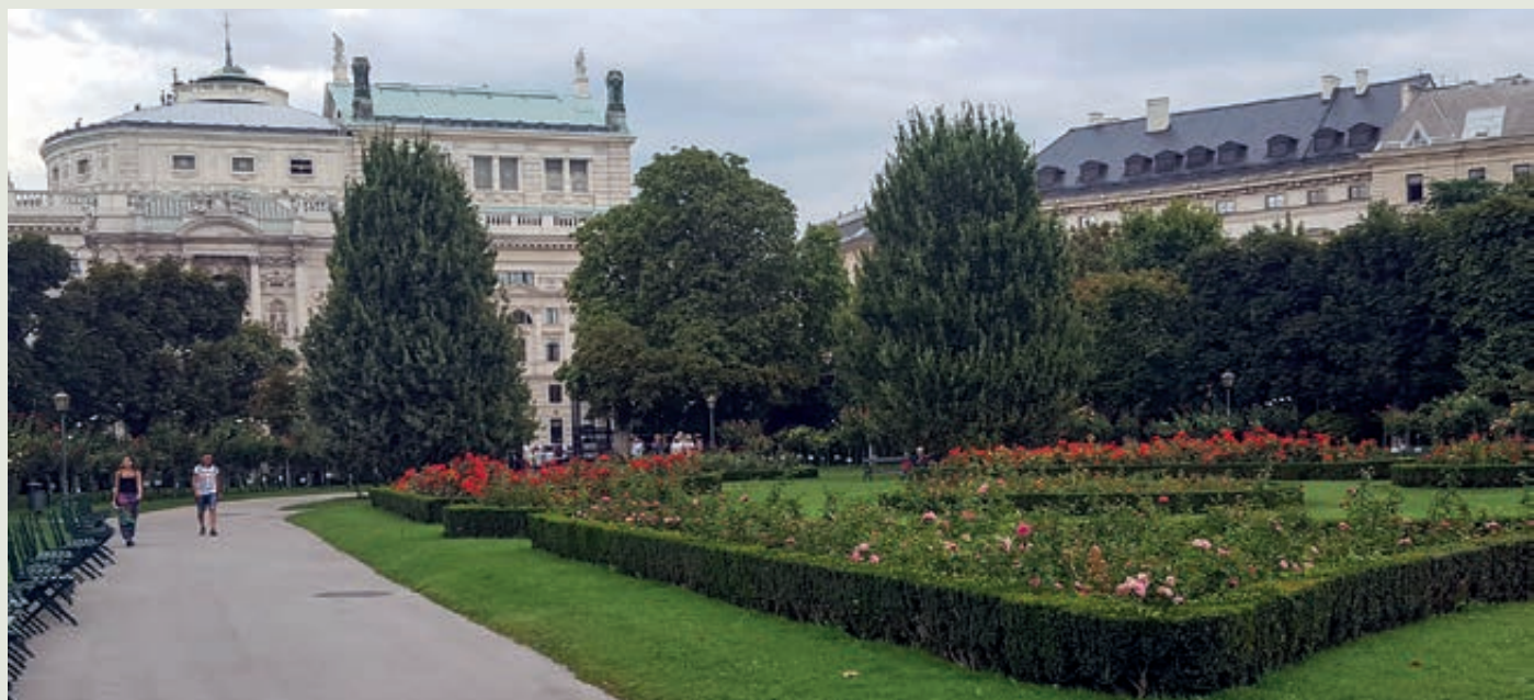
Upravené záhrady a parky sú obľúbeným cieľom letných prechádzok