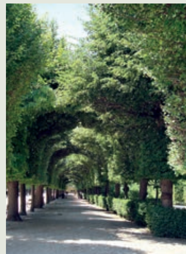
Aleja v Schönbrunne

Záhradný úrad zamestnáva 900 záhradníkov, 1 800 záhradníckych robotníkov a 70 záhradníckych učňov. V rámci centrálnych ležiacich parkov a mestských záhrad sa nachádzajú ohradené priestory pre technicko-personálne zázemie záhradníkov, napr. Türkenschanzpark, Stadtpark a pod. Tak majú nielen tieto parky, ale aj okolité zelené