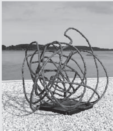
Jeden z exteriérových exponátov