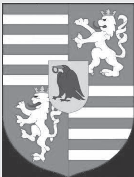
Erb kráľa Mateja

Pavel Dvořák – Matej Korvín a Beatrix Matej I. – Wikipedia History Web Sk