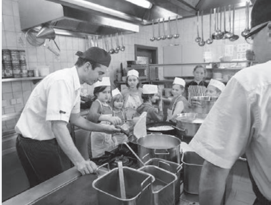
Mali kuchári po prvýkrát v profesionálnej kuchyni

Naša špecialita a zároveň veľmi obľúbené jedlo sú zemiakové placky – klasické podľa receptu našej babky. Aj sme už naučili domácich, že si objednávajú jedlá s pôvodnými názvami. Veľký hit je plnený bramborák (pod týmto názvom aj v jedálnom lístku). Sviečkovú na smotane so žemlovou knedľou sme nazvali Prager Rindsbraten. Hostia si