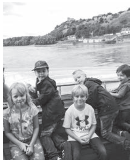
SOVA na výlete v Bratislave