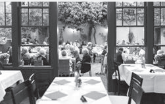
V lete si hostia radi posedia vonku

Aké jedlo si hostia objednávajú najčastejšie? Skúsia aj niečo, čo nepoznajú, alebo len tradičné (viedenské) jedlá?