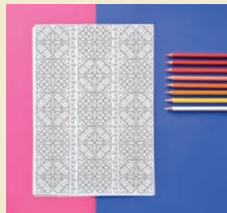
Omalovánky z Tomášovej autorskej dielne

Prvý reálny náklad bol 500 výtlačkov, tie sa vypredali za 3 mesiace a odvtedy sa kniha doťlačila ešte dvakrát. Dovedna vyšlo 2 500 ks.