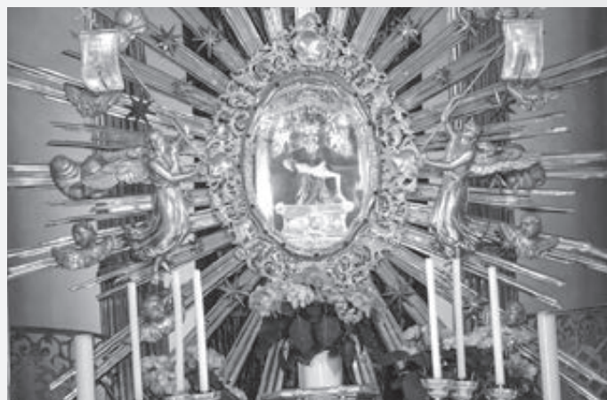
Soška Sedembolestnej Panny Márie na hlavnom oltári