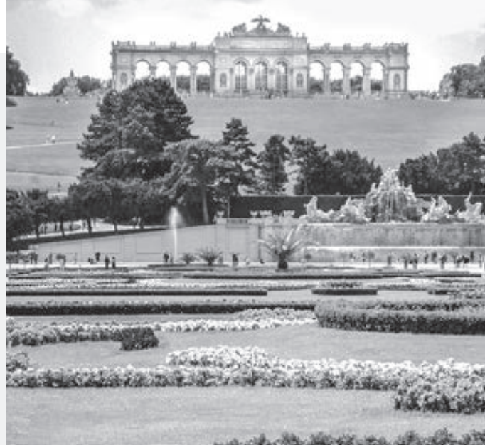
Parková úprava pred Gloriette

reprezentačných víl, ale na realizáciu anglického parku na pôde bývalej obrannej línie proti Turkom. Z iniciatívy architekta Heinricha Ferstla bol v roku 1872 založený spolok Wiener Cottage, ktorý riadil stavebnú činnosť. A tak vznikol jeden z najkrajších parkov vo Viedni, obkolesený reprezentačnými vilami s výhľadom na park v tzv. Cottage polohe, dnes hodnotenej z hľadiska jej kvality veľmi vysoko. Dnešný 18. obvod Währing patrí v tejto časti k jednému z najvyhľadávanejších mestských obvodov na bývanie a z hľadiska cien aj k tým najdrahším. Keď v roku 1888 cisár František Jozef I. park otváral, jeho reč o tom, že plánuje postupne pripájať predmestia ku Viedni, sa stretla s veľmi pozitívnym ohlasom a bola impulzom pre ďalší rozvoj mesta.