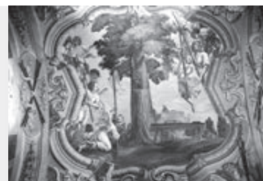
Freska zjavenia anjelov pri dube