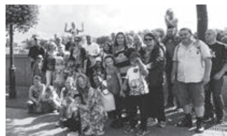
Malí i veľkí vyletníci

Jednou z takýchto „stmeľovacích“ aktivít bol aj septembrový výlet do hlavného mesta Slovenska. Do posledného miesta zaplnený autobus nás dovezol najskôr na Devín, kde sme si prezreli hradný vrch. Po ceste k múzeu si deti mohli vyskúšať šermovanie so skoro naozajstným mečom, zahrať si drevené koly, obdivovať remeslo starých kožiarov a rodičia sa nechali presvedčiť o kvalite výborného devínskeho ríbezľového vína. Z hradu sa nám naskytl krásny pohľad na obidve vodné krásavice Dunaj a Moravu,