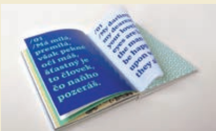
Ukážky z knihy AHA

rôzne facebookovské stránky blízke dizajnu, aby informáciu zdieľali. A takmer všetci mi vyšli v ústrety a pomohli. Postupne sa to teda nabalovalo a asi po týždni už peniaze pribúdali pravidelne. Po dvoch týždňoch sa vyzbierala cieľová suma 2 000 eur a po mesiaci nakoniec 4 500 eur. Každý deň som odpovedal na správy záujemcov, komunikoval s ľuďmi. Bola to práca na plný úväzok. Ale ten pocit, že ľudia mali o knihu záujem, za to stál.