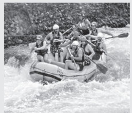
Na divokej vode