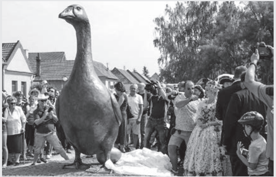
Odhalenie sochy husi v Slovenskom Grobe