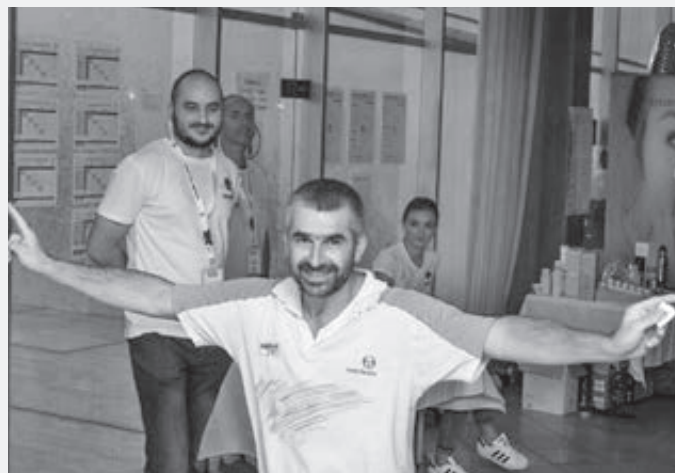
Šťastný výherca tomboly