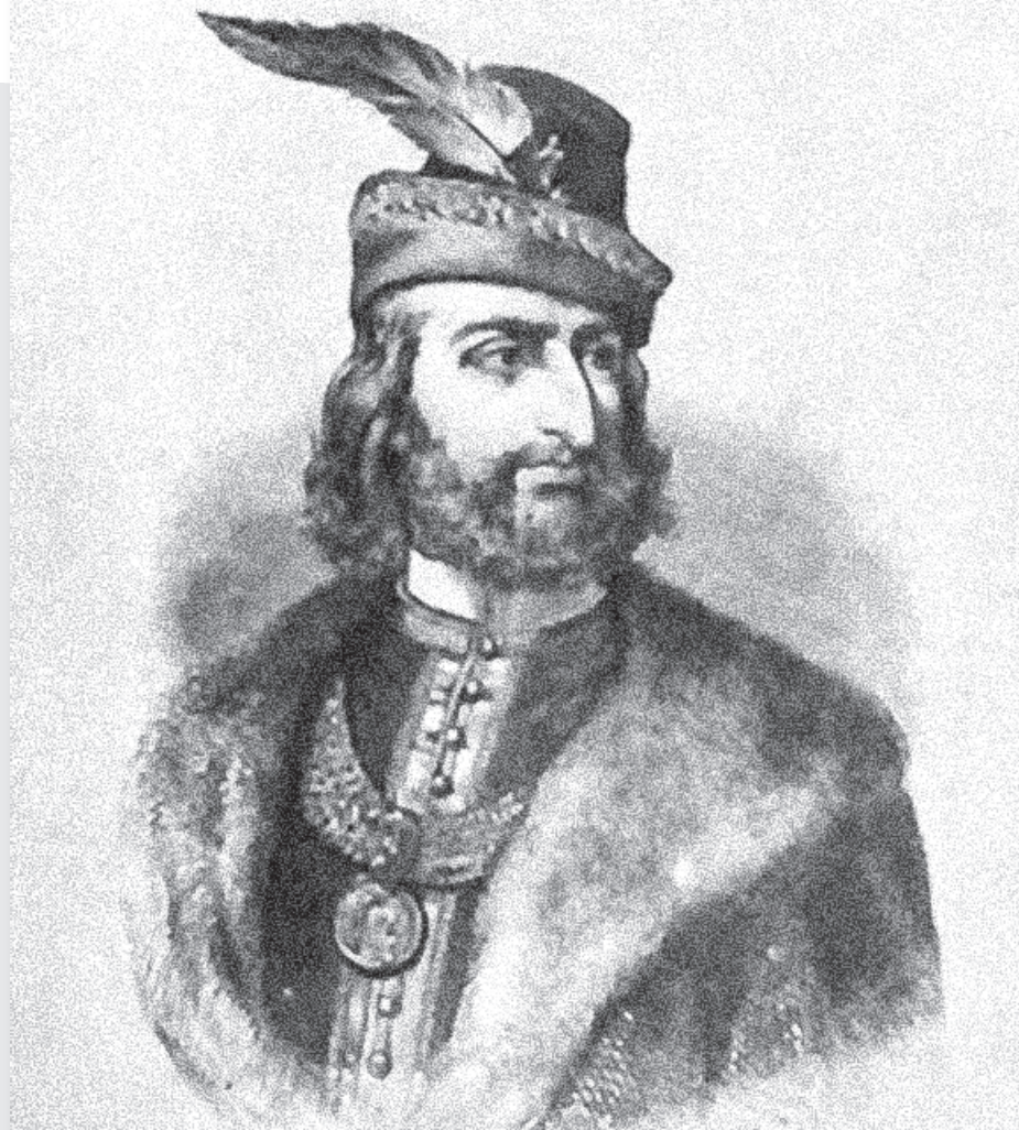
Matej Korvín - významná historická osobnosť

V roku 1458 ho takmer 15-ročného zvolili za uhorského kráľa, v roku 1459 sa dal časťou českej šľachty zvoliť v Olomouci aj za českého kráľa. V roku 1485 sa stal rakúskym vojvodom a svoje hlavné sídlo presunul do Viedne. Mladý Matej mal za sebou podporu strednej a nižšej šľachty, ako aj silnej huňadyovskej ligy. Celý jeho život bol opradený mnohými povestami. Vraj to bol pohotový kráľ, veľmi bystrý, s vycibreným jazykom a pamäťou, ktorú neustavne cvičil. Na druhej strane bol vychýrený svojou divokou povahou. Ak sa mu niekto postavil