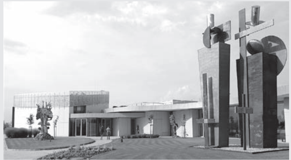
Pred vchodom do Danubiany

... ak sem prídete v lete, potom si určite skúste zmerať sily s vodným prírodným živlom. Slúži na to areál Divoká voda – park oddychu, zábavy a športu, ktorý sa nachádza presne oproti Danubiany, na druhej strane cesty. Na svoje si tu prídu milovníci raftingu, ktorí sa s perejami môžu popasovať priamo na 350 m dlhej trati, na ktorej sa konali aj majstrovstvá sveta. Túto vodnú atrakciu obľubujú vraj hlavne mladí muži z Anglicka, ktorí sa sem prídu lúčiť so slobodou. Je tu tiež škola kajaku, no vyskúšať sa dá aj Stand up Paddle (SUP), hydrospeed alebo surfovanie na umelo vybudovanej vlne (River Surfing). Kto nenájde odvahu, môže aspoň pozorovať a povzbudiť tých, ktorí skončia vo vode. V areáli je aj detská zóna, reštaurácia a ubytovacie možnosti.