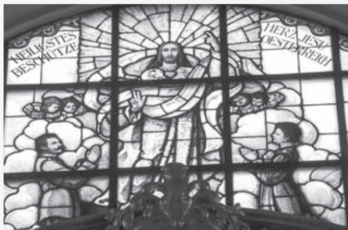
Rakúsky cisár Karol I. s manželkou Žofiou na vitráži

Od otvorenia hraníc v roku 1989 putuje do Maria Taferl aj čoraz viac pútnikov zo Slovenska. Prispievajú tým k počtu pútnikov do 300 000 ročne, ktorí v súčasnosti navštívia toto malé pútnické mestečko s 850 obyvateľmi. Prichádzajú pohodlne autobusom, alebo od určitých úsekov pešo, pre mnohých je to zastávka na púti až do Santiaga de Compostela. Tu v Maria Taferl sa pomodlia, zapália sviečku v kaplnke na to určenej alebo sa umyjú vodou, ktorej sa oddávna pripisovali zázračné liečivé účinky pri problémoch s očami. Pre Slovákov je bazilika blízka tým, že je zasvätená Panne Márii, patrónke Slovenska, a preto ju mnohí krajanovia nazývajú slovenský Šaštín. ■