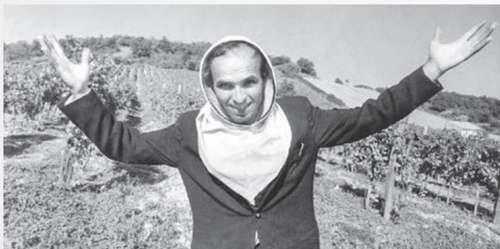
Ako včelár v Hamišťle, okolo r. 1970