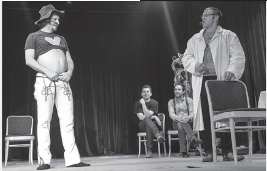
Počas prednášky o pestovaní zemiakov na Mesiaci

Rozumejú tomuto typu humoru aj Slováci a Česi v zahraničí?