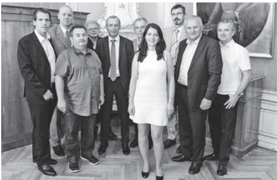
Staatssekretärin Muna Duzdar und Vertreter der Volksgruppen in ihrem Büro