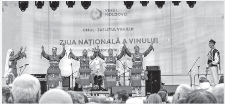
Na Festivale vína vystupovali domáce folklórne súbory...

Kontrakt v Orangei mi skončil v roku 2005. Teraz mám spoločnosť, ktorá sa zaoberá organizáciou podujatí a je to aj cestovná agentúra – Tatra-bis. Sme dvaja majitelia, ja ako Slovák – preto sú Tatry v názve a bis – to keď sa povie, tak to znamená ešte raz to otočiť, ešte raz to zopakovať. Veľa firiem tu má túto koncovku bis. Pôvodne bolo našim cieľom organizovať výjazdny cestovný ruch, t.j. posielat' Moldavčanov na Slovensko. Lenže v roku 2004 Slovensko vstúpilo do EÚ, víza sa vydávali v Rumunsku – čiže Moldavčan, ktorý chcel vycestovať na Slovensko, musel ísť najprv do Rumunska. S vízami boli ošтары, videli sme, že situácia je zlá, záujem bol minimálny, a skôr len u tých, čo chceli emigrovať do západnej Európy, najmä do Talianska. Vybavili si naše víza, ale na Slovensko ani nešli. Potom sa situácia ešte viac zhoršila, keď aj Rumunsko vstúpilo do Únie – ak chcel Moldavčan ísť na Slovensko, musel si vybaviť víza v Rumunsku, ale najprv si musel vybaviť vízum do Rumunska... V tom období sme ale mali veľmi dobré skúsenosti s turizmom v Moldavsku. Ja som už poznal celú krajinu. Ešte ako komerčný riaditeľ Voxtelu som sa totiž dostal všade, často aj na také miesta, kde bežný Moldavčan ani nebol. Vďaka mojej pozícii som sa dostal do tunajších kostolov,