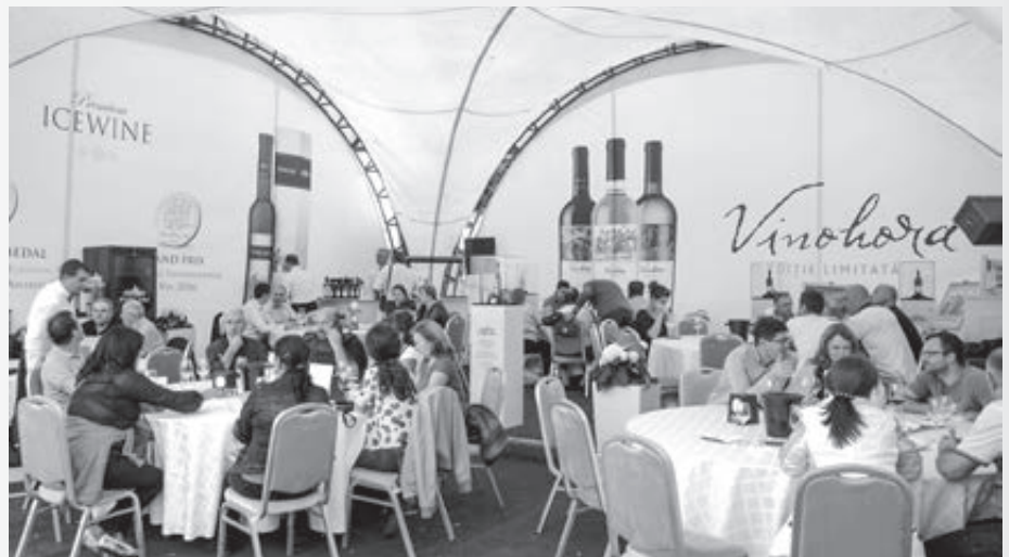
... a predstavovali sa všetky významné vinárske podniky krajiny

aby sme zorganizovali podujatia pre ich klientov alebo manažérov, ktorí sem prichádzali na workshopy, mítingy či firemné akcie. A tak sme začali organizovať podujatia – eventy. Vtedy sa ešte nikto nevenoval turizmu do Moldavska, my sme vlastne boli prví, čo sme sa začali zaoberať promovaním tejto krajiny. V roku 2006 sme vydali náš prvý katalóg pobytov v Moldavsku a otvorili aj webstránku. Moja prvá klientka bola Ukrajinka, ktorá sa špecializovala na národné kroje. Zobrali sme ju do etnografického múzea. Bol marec 2006, firmu tvorili traja ľudia: ja, kolegyňa, ktorá je spolumajiteľka, a guide (sprievodca